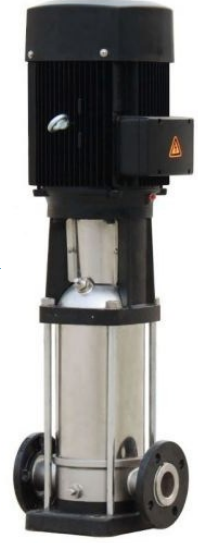
Solar Motor ve Pompa