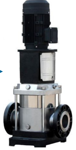
Solar Motor ve Pompa