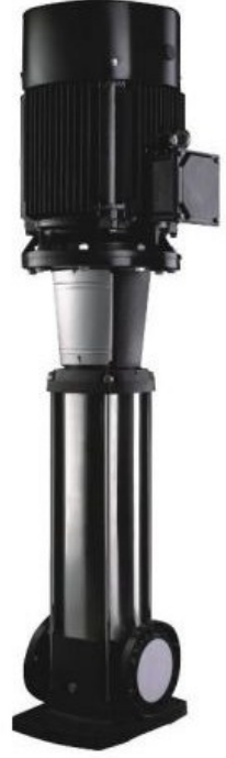
Solar Motor ve Pompa