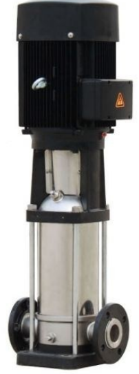
Solar Motor ve Pompa